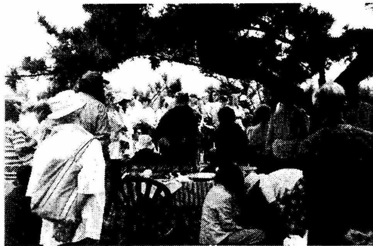
オールドセメタリーソサイエティーによる日本人の墓紹介